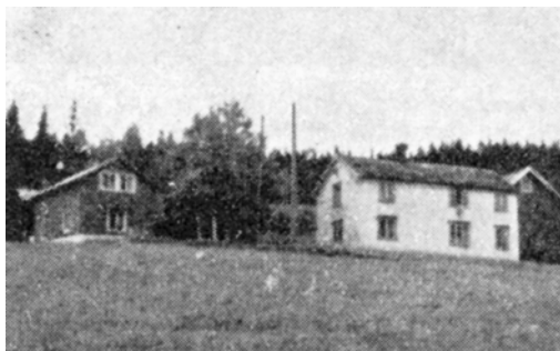
Åsan, Gnr. 156 br. 5

Dette var opprinnelig en husmannsplass under Ne-stu Støbærje (Gnr. 156 br. 3) og hadde navnet Stubergsåsen, men gikk i dagligtale under navnet «Åsom».